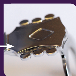
Clip stylo MIM