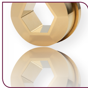
Matrice de découpe acier revêtue de PVD