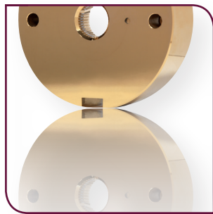
Matrice de filage carbure revêtue de PVD

La faculté unique du traitement MMP de pouvoir sélectionner la rugosité, augmente considérablement l'aptitude des surfaces aux fonctions spécifiques d'utilisation des outils de forge, frappe et découpe.