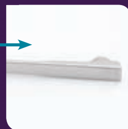
Titane grade 5