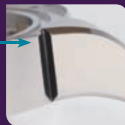
Acier, Or, Platine