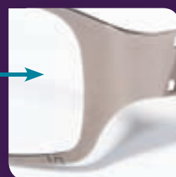
Titane grade 5