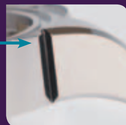
Stahl, Gold, Platin